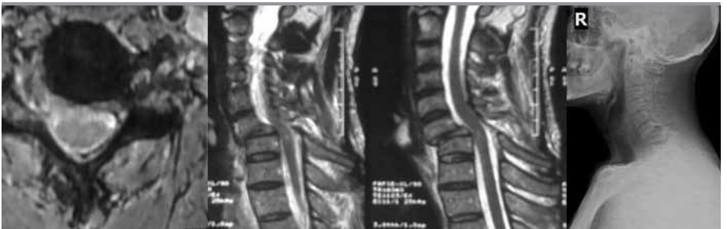
Şekil 5. Radyolojik görüntüleme de C6-7 seviyesinde dislokasyon