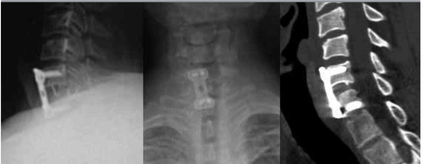
Şekil 4. Operasyon sonrası AP- lateral servikal direkt grafisi ve servikal CT