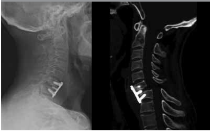
Şekil 6. X-ray görüntülerinde cerrahi sahada plağın yerinde olmadığı görülüyor

İlk kez 1982 yılında Roy-Camille tarafından uygulanan lateral mass vida tekniği sonraları Magerl, Anderson ve An tarafından modifiye edilmiştir (1). Genellikle redükte edilemeyen faset kilitlemesi, spinöz çıkıntı, lamina hasarının olduğu ve posterior dekompresyon gerektiren durumlarda tercih edilir (13).