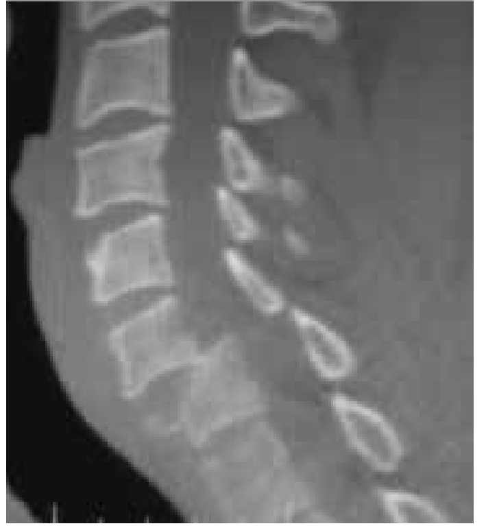
Şekil 2. Servikal CT de C6-7 seviyesinde dislokasyon, faset eklemlerde kilitlenme ve C7 vertebra korpusu anteriorunda gözyaşı fraktürü saptandı

Hareketle şiddetlenen boyun ağrısı ve sol tarafta belirgin olmak üzere tüm ekstremitelerde kuvvet kaybı olan 43 yaşında erkek hasta getirildiği acil serviste görüldü. Nörolojik muayenede, sağ üst ekstremitede distallerde kuvvet kaybı (el bilek fleksiyon ve ekstansiyonunda %80-90 kayıp), sol hemipleji ve bilateral C5 altında hipoestezi saptandı. Servikal grafide C6-7 dislokasyon bulgusu üzerine çekilen servikal bilgisayarlı tomografi de C7 vertebra anteriorunda fraktür olduğu, bilateral faset kilitlemesi ve C6-7 seviyesinde dislokasyon olduğu görüldü (Şekil 1,2). Servikal MR görüntülemesinde ise; anteriordan belirgin spinal kord basısı ve posterior longitudinal ligaman hasarı saptandı (Şekil 3). Allen-Ferguson sınıflaması kompresyon fleksiyon tipi yaralanmaya posterior longitudinal ligaman yırtığının eşlik etmesi üzerine hasta ameliyata alınarak redüksiyon ile faset kilitlemesi açıldıktan sonra anteriordan diskektomi, cage ve plak-vida sistemi ile stabilizasyon uygulandı. Postoperatif dönemde görüntüleme yöntemleri ile cage ve vidaların yerinde olduğu ve redüksiyonun başarılı olduğu görüldü (Şekil 4). Hasta rehabilitasyon merkezine yönlendirilmek üzere taburcu edildi.