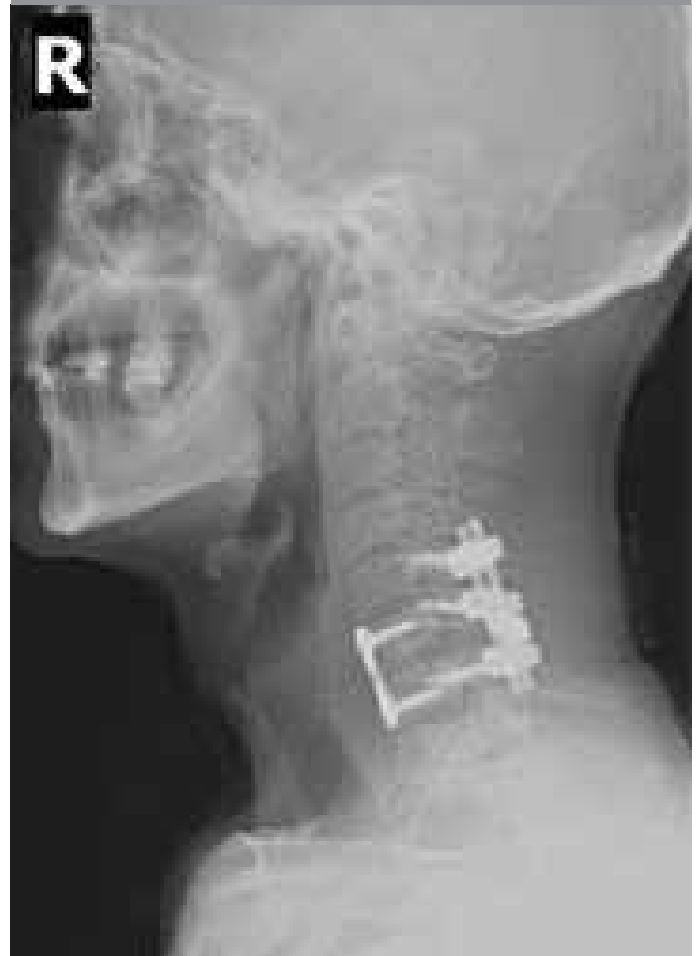
Şekil 7. Radyolojik görüntülemde anterior revizyon ve posterior lateral mass vida ile stabilizasyon

Ethics Committee Approval: Ethics committee approval was received for this study from the ethics committee of Osmangazi University.