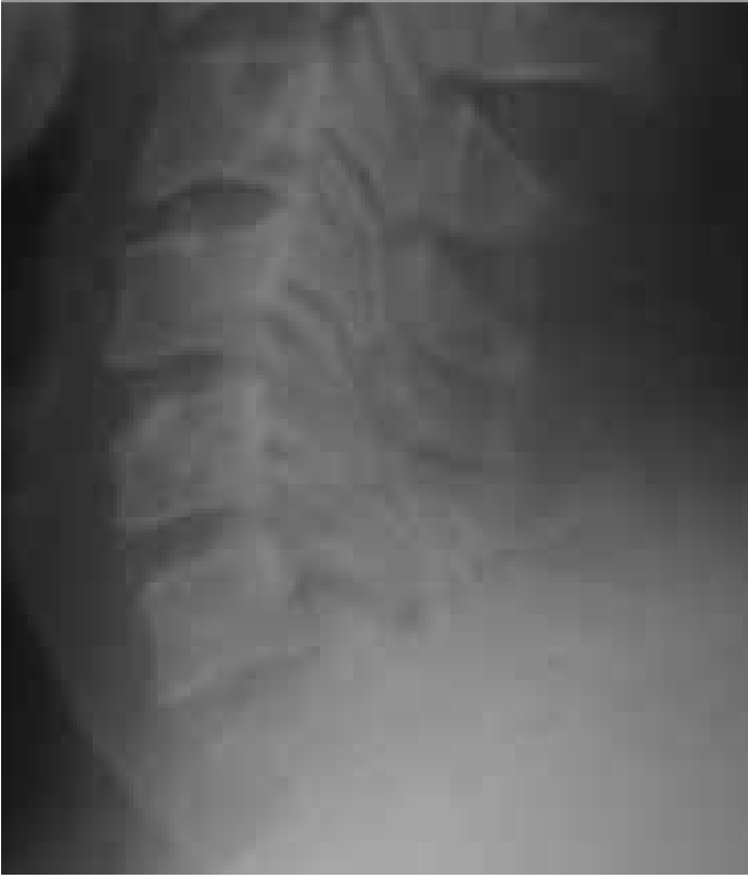
Şekil 1. C6-7 dislokasyon (preoperatif lateral servikal direkt grafisi)

için kullanılmaktadır. Nörolojik değerlendirme için güncel ve son zamanlarda kullanımı yaygınlaşan sınıflama motor, duyu kayıpları ve bunlara bağlı özürülük oranlarını içeren ASIA (American Spinal Injury Association) sınıflamasıdır (5, 6). Subaksiyal servikal travmalarda akut nörolojik kötüleşme acil cerrahi endikasyonudur. Cerrahi kararı ligament ve kemik harabiyetine bağlı olarak verilir. Cerrahide öncelikli amaç nöral yapıların tam olarak korunmasıdır (1).