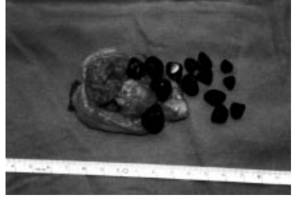
Resim 2: Safra kesesi polibinde adenokarsinom rastlanan olgunun makroskopik görünümü. Tümöre kolelitiazisin eşlik ettiği görülmektedir.

**14 Kolesterol polibi, 2 adenom, 1 adenokanser