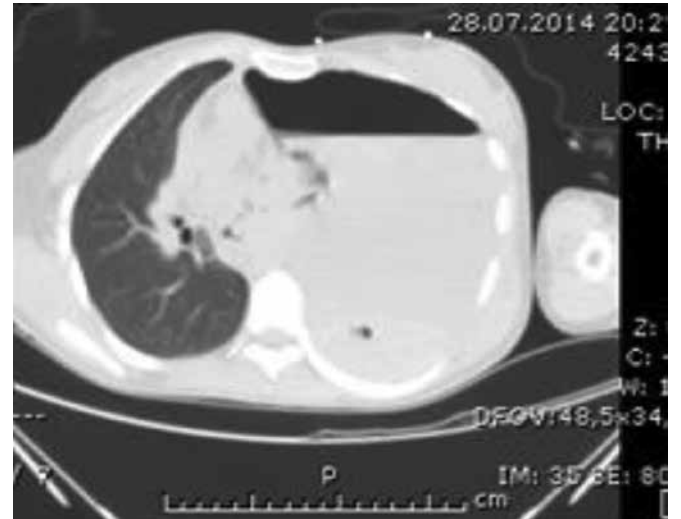
Resim 3. Thoraks bilgisayarlı tomografi görüntüsü