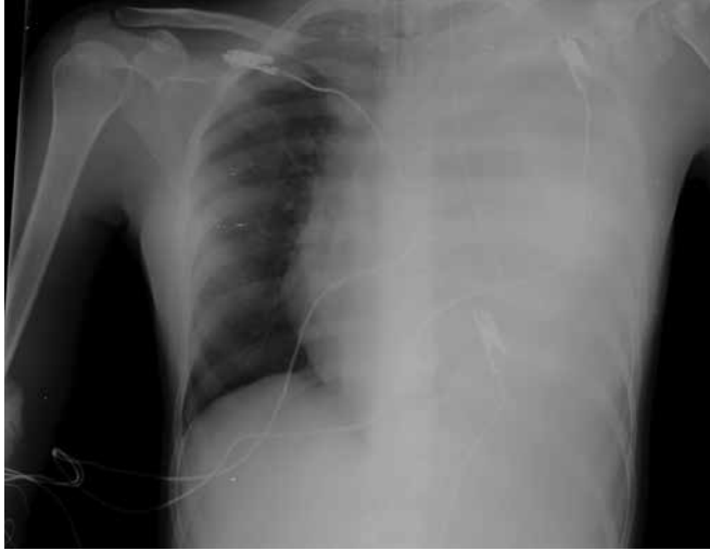
Resim 1. Anterior-posterior akciğer grafisi görüntüsü

Mekanik vasküler komplikasyonlar; genellikle ponksiyon iğnelerinin, kılavuz tellerin ve dilatatörlerin özensiz kullanımına bağlı ortaya çıkabilir. Ponksiyon iğnesinin yanlış yönlendirilmesi, kan aspire edilmeden kılavuz telin yönlendirilmesi, telin bükülmesi, çoklu deneme sayısı, şiddetli dehidratasyon, morbid obesite ve koagülopati risk faktörleridir (8). Iwakura ve ark. (9), ASD/VSD onarımı öncesi hastalarının sağ İJV'ye SVK uygulamışlar, ekstübasyon sonrası solunum sıkıntısı gelişmesi