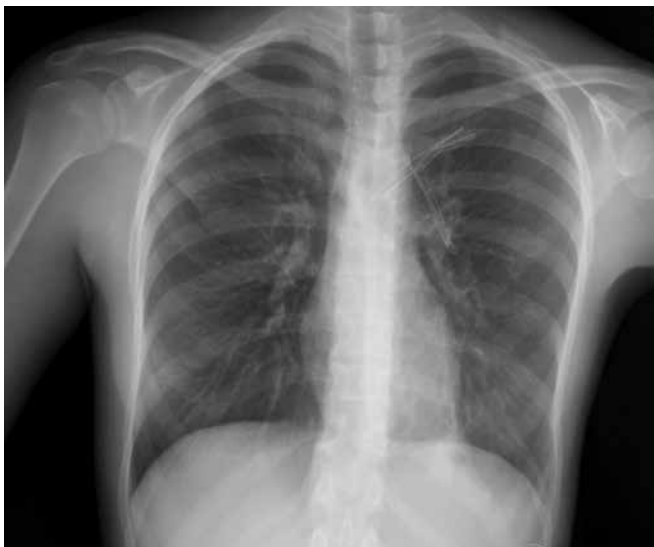
Resim 5. Postoperatif 5. gün anterior-posterior akciğer grafisi görüntüsü