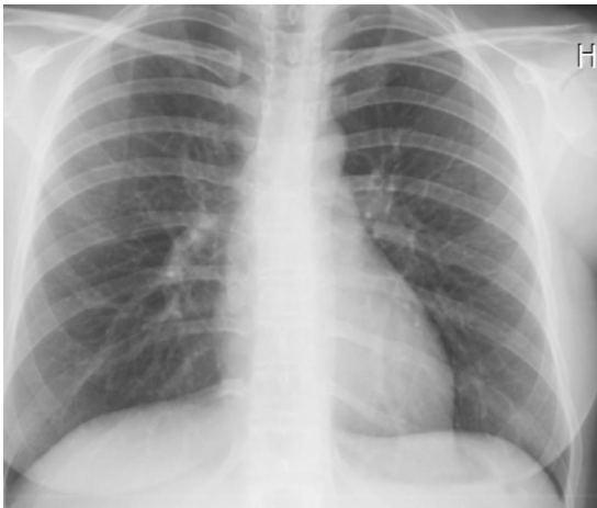
Resim 3. Posteroanterior akciğer grafisi; 10. günde tam radyolojik düzelme

Fizik muayenede taşipne, taşikardi, ateş, ral, wheezing ve siyanoz görülebilir. Akut hipoksi kimyasal pnömonit hastalarında sık görülür. Artan lökosit ve nötrofil değerleri aspirasyon pnömonisinde sık görülse de, pnömonitte de görülebilir. Aspirasyon pnömonisinde balgam kültüründe üreme beklesek de, esas patojen anaerob olduğunda üreme olmayacağı unutulmamalıdır (6,7). Literatürde olgumuzda görülen anafilaksi sonrası gelişen kimyasal pnömonit belirtilmemiştir. Olgumuzda da balgam kültüründe üreme olmamıştı. Bu durum tek başına pnömonit tanısını koymaya yeterli değildir. Olgumuz; yukarıda bahsedilen öykü, semptom, fizik muayene bulguları, akut başlangıç, öksürükle gelen mide içeriği gibi bulgularla beraber aspirasyon pnömoniti olarak kabul edildi. En belirgin özellik ise hızlı başlangıç ve hızlı düzelmeydi.