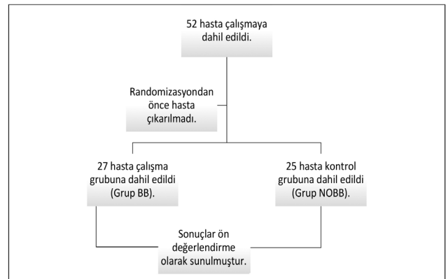
Şekil 1. Akış diyagramı

Giriş DKH ile hedef ritme ulaşmakta geçen süre arasında ilişki yoktu ( p=0,125 ). Grup BB'de 6 hastanın giriş kalp hızı 95 vuru/dk'nin altındaydı ve takip eden 4 günde bu limitin üzerine çıkmadı. Dolayısıyla esmolol infüzyonu yapılmadı. Bu hastalarda 28 günlük mortalite oranı 0'dı. Dokuz hastada 24 saatte, 6 hastada 48 saatte, 2 hastada 72 saatte, 1 hastada ise 96 saatte hedef DKH olan 95 vuru/dk'ye ulaşıldı (Tablo 3). Yine bu grupta 3 hastada (%11) belirlediğimiz maksimum doz (100 mcg/kg/dk) esmolol infüzyonuna rağmen hedef DKH'ye ulaşamadı. Bu 3 hastada 28 günlük mortalite oranının 0 olması dikkati çekmektedir. Konvansiyonel tedavi alan grup NOBB'de ise sadece 7 hastada (%28) kalp hızında hedeflenen azalma sağlanamadı. Esmolol infüzyonuna bağlı iki grup arasındaki anlamlı farklılık ise ancak 4. güne gelindiğinde ortaya çıktı ( p<0,05 ). Bunu; yapmış olduğumuz dikkatli titrasyon ve limitli esmolol kullanımına bağladık. Ortalama arteriyel basınçlar açısından ise iki grubun günlük seyirleri benzerdi ( p>0,05 ). Takipler boyunca SOFA skorları arasında anlamlı farklılık yoktu ( p>0,05 ) (Tablo 4).