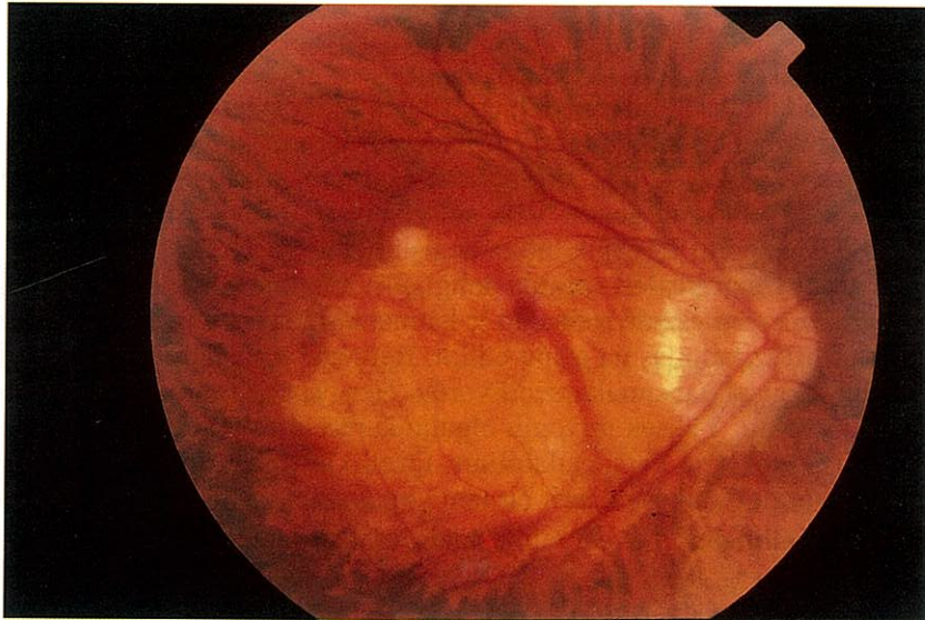
Resim 1. Hastanın sağ (A) ve sol (B) gözüne ait renkli fundus fotoğrafları

Kırkyedi yaşındaki erkek hasta kliniğimize her iki gözde son altı aydan beri görme azalması şikayeti ile müracaat etti. Travma hikayesi olmayan hastanın sağ gözünde -17.00 dioptiri, sol gözünde -19.00 dioptiri refraksiyon kusuru vardı. Hastanın yapılan oftalmolojik